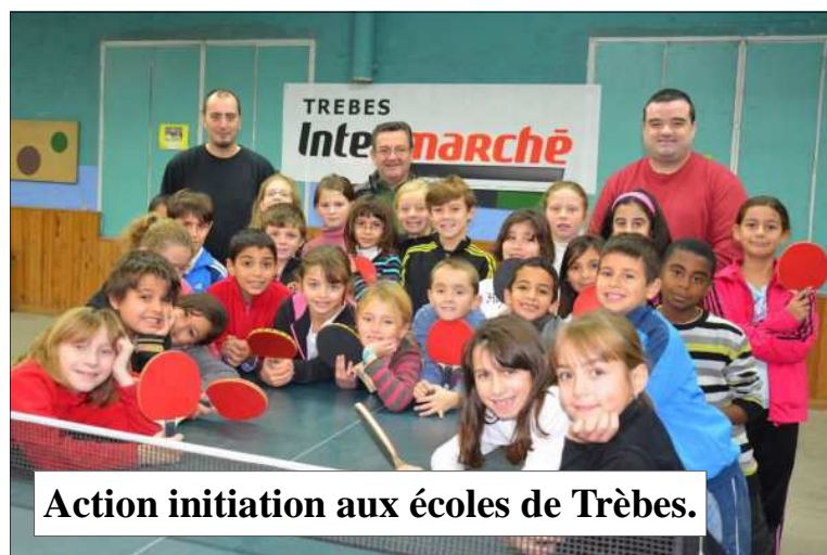
Action initiation aux écoles de Trèbes.

Vente de calendriers dans le hall d'Intermarché Trèbes par des jeunes du club portant le survêtement Intermarché.