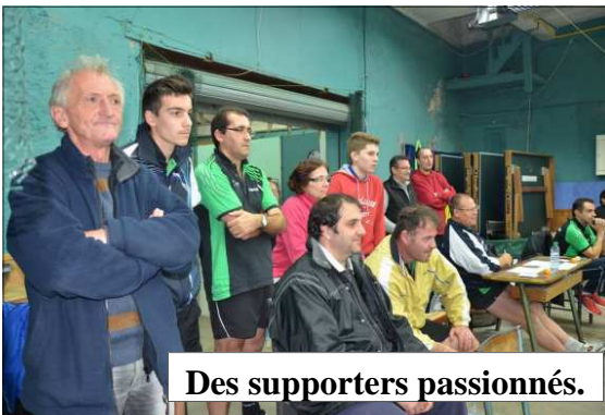
Des supporters passionnés.