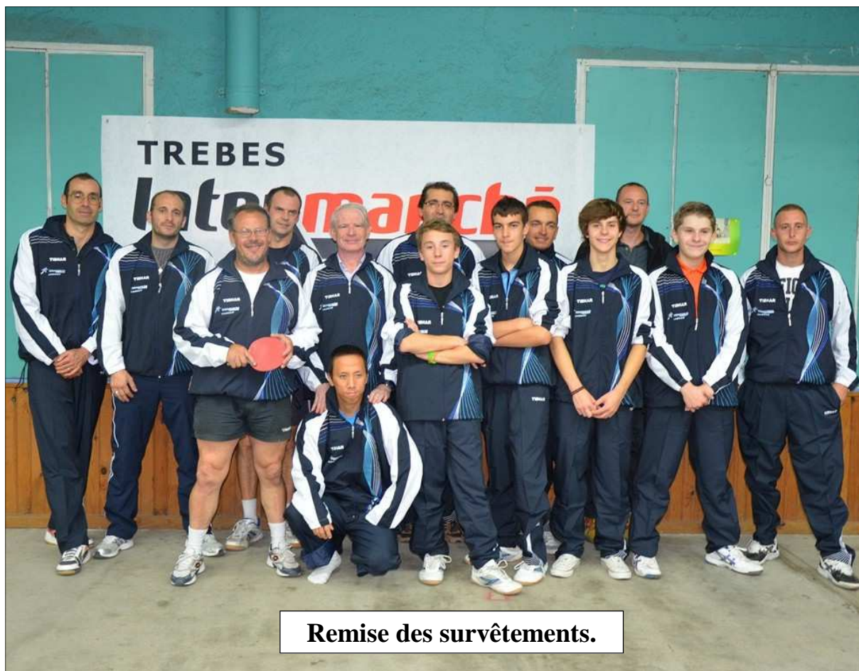
Remise des survêtements.