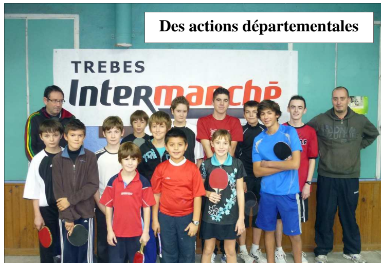
Des actions départementales