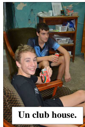
Un club house.