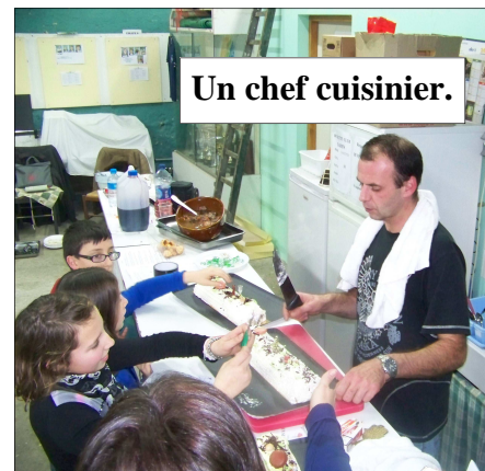
Un chef cuisinier.