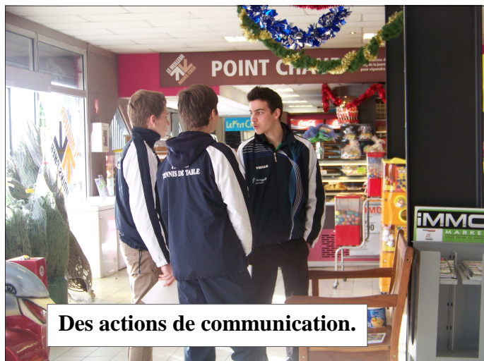
Des actions de communication.