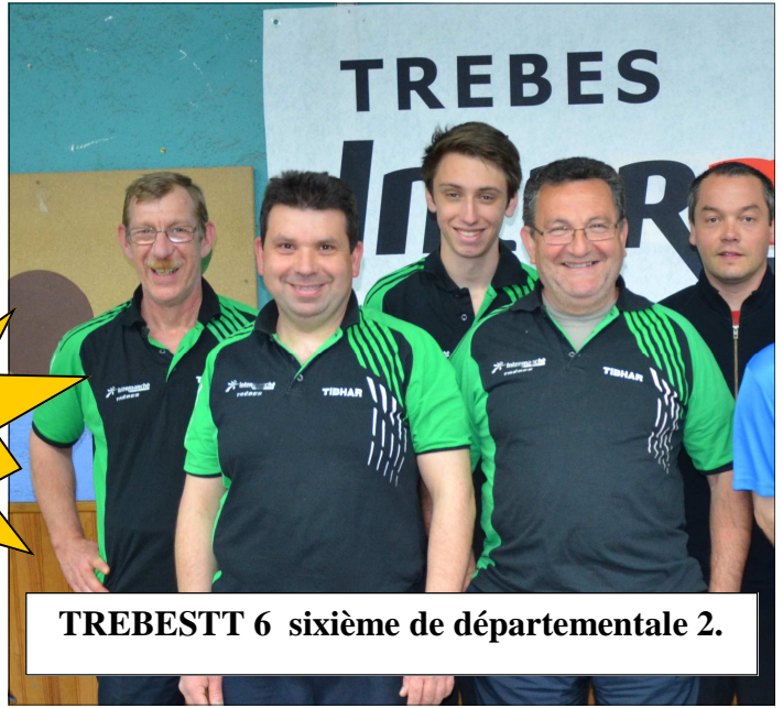
TREBESTT 6 sixième de départementale 2.