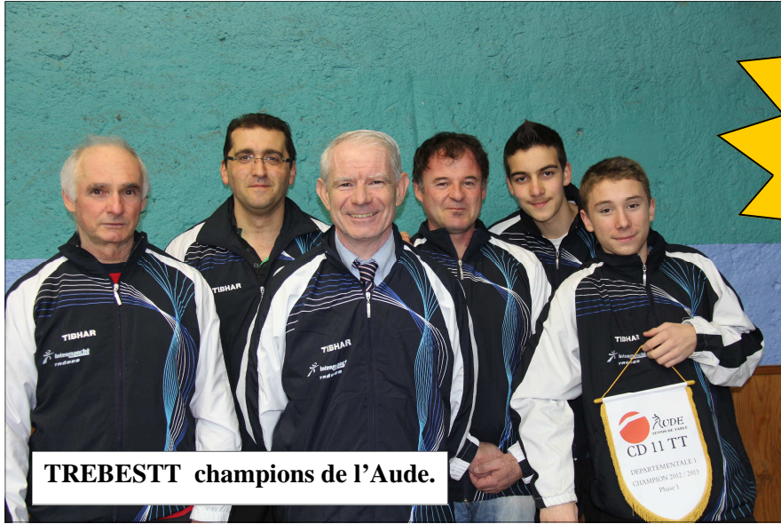
TREBESTT champions de l'Aude.