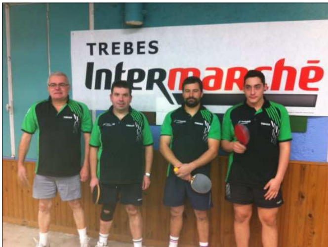
Autres joueurs de Départementale1.