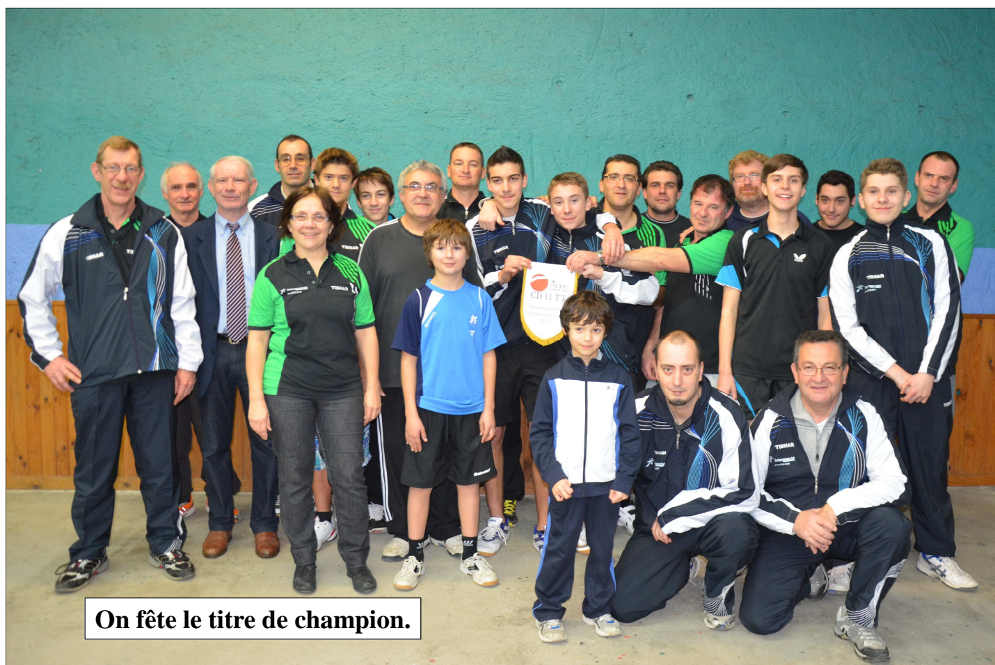
On fête le titre de champion.