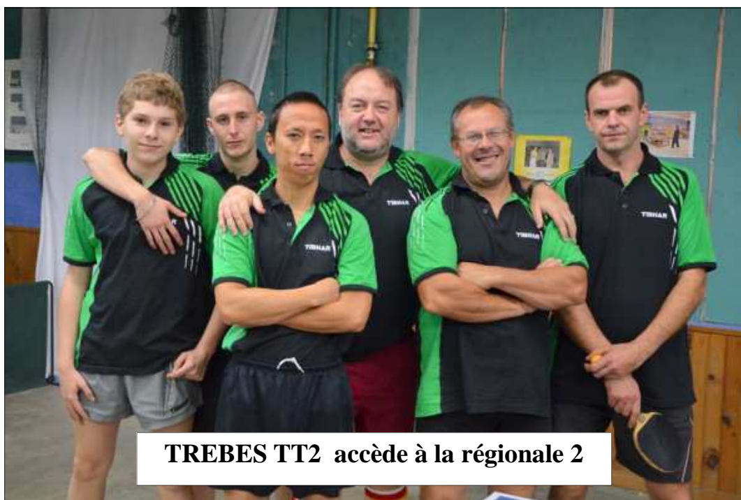
TREBES TT2 accède à la régionale 2

TREBES TT2 3ème de régionale 3 accède à la régionale 2, TREBESTT3 se maintien en régionale 3.