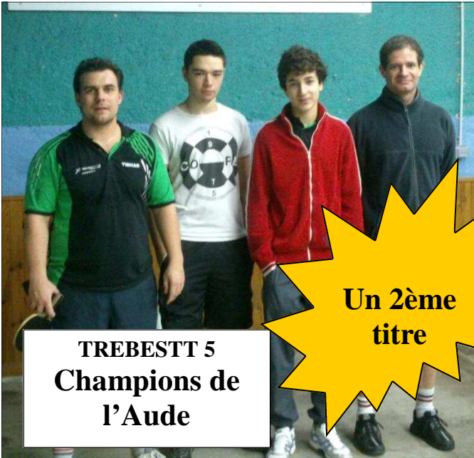
TREBESTT 5 Champions de l'Aude